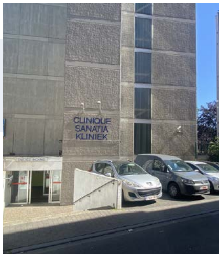
Sanatia, Psychiatrisch ziekenhuis