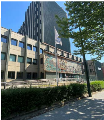
Valida, Neuro-locomotrisch en geriatrisch revalidatiecentrum