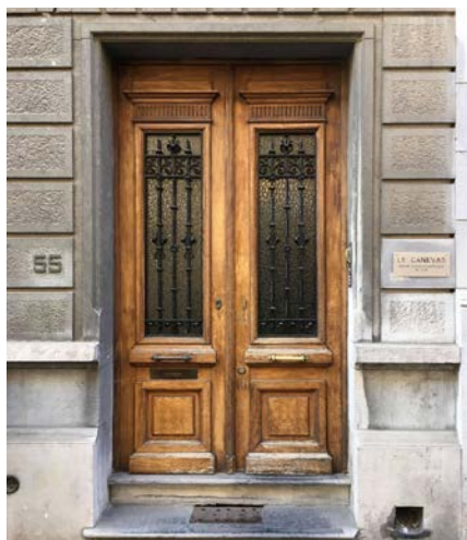
Het Canevas, Psychotherapeutisch dagcentrum