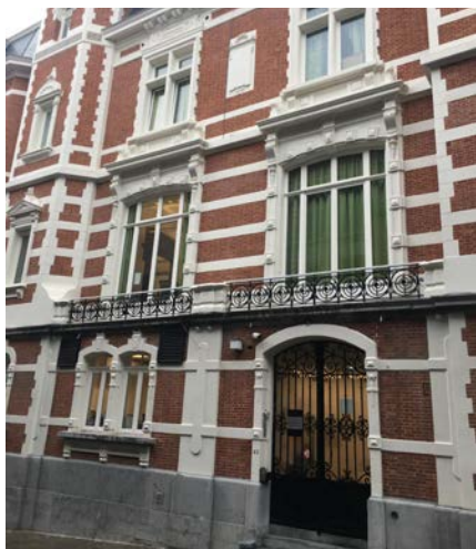
PVT, Psychiatrisch verzorgingstehuis